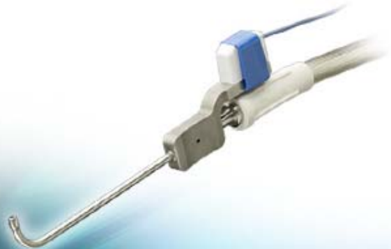
Aspirador curvo, 90°