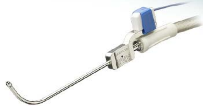
Aspirador curvo , 70°