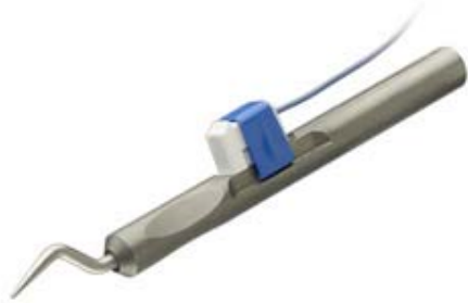
Transductor de registro

Espejo del juego de instrumentos que se utilizarían en cirugía ORL sin navegación (incluye bandeja de instrumentos por encargo )